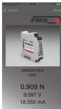
... läs av aktuell banspänning